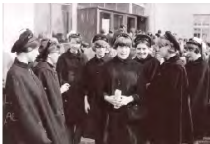
LIIIIb:s lärda abiturienter