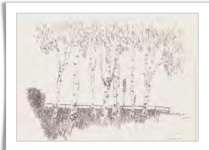
Björkallé vid läroverket - från en teckningslektion 1965