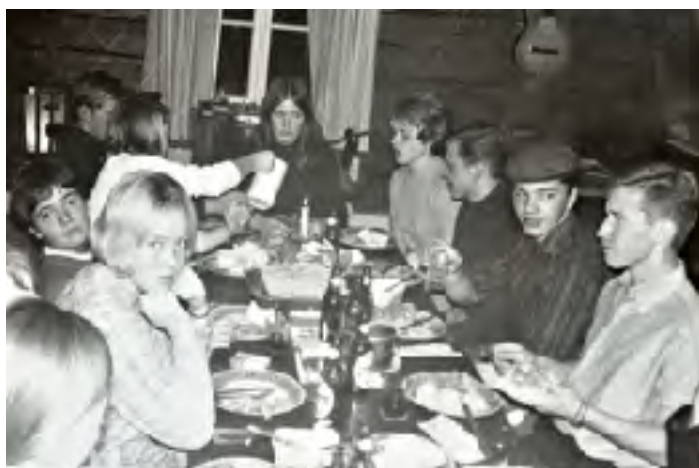
RIIlb Surströmming på Tärnaklippen 1966