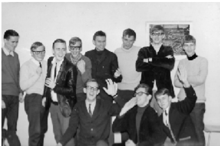
Riilc Stöddiga saker? - alla fick inte plats